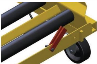
Pestillo de seguridad para evitar que se caiga la batería

Placa de empujar/tirar impulsada mecánicamente