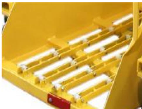
Perfil bajo para una altura de carga de 3" (-LP)