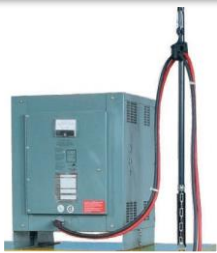
Retractor de cable para baterías opcional (BCR-58H)