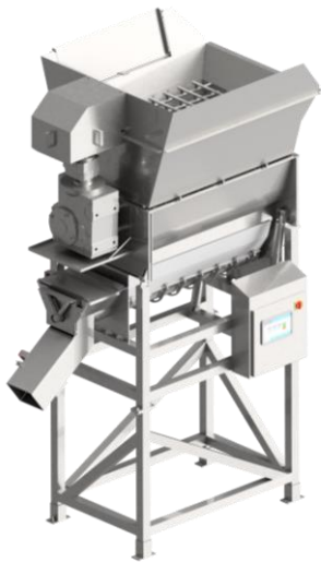
MTC Serie FB

El Triturador de Bloques Congelados de MTC se utiliza para romper combos de productos de congelado rápido individual (IQF) y productos re-congelados en combos o en forma de bloque templado. Hecho de acero inoxidable con soldaduras de sellado al 100% para facilitar el saneamiento y la durabilidad, el triturador de bloques congelados viene con un control de ciclo programable y un controlador programable que puede almacenar programas para diferentes productos. El diseño MTC centrado en la seguridad garantiza que el triturador de bloques congelados funcione solo cuando todas las puertas estén cerradas y aseguradas en su lugar. El triturador de bloques congelados se opera hidráulicamente y viene con una unidad de poder de 15 HP.