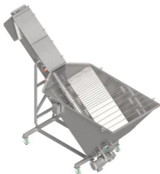
MTC Serie MTCS

Los transportadores de tornillo MTC están diseñados para mover productos frescos y congelados de un lugar a otro. Vienen en varias configuraciones, incluyendo portátiles y estacionarios. Los transportadores de tornillo sin fin de MTC están disponibles en diámetros de 6 a 24 pulgadas para adaptarse a sus necesidades. Todas las unidades están hechas de acero inoxidable y tienen diseño sanitario y cubiertas de artesa con bisagras con enclavamientos de seguridad. Las características de seguridad adicionales incluyen pestillos de puerta y rejilla. Las opciones incluyen motores reversibles e imanes de tierras raras.