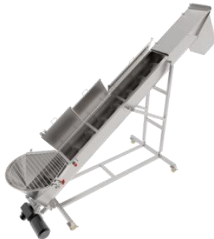
MTC Serie MTCS

Los transportadores de banda MTC están hechos a la medida, vienen en diferentes anchos y longitudes, y están disponibles en modelos estacionarios o portátiles. Su construcción de acero inoxidable garantiza una larga vida útil y facilidad de saneamiento. Las bandas transportadoras MTC varían en estilo según los requisitos de la aplicación. Todas las bandas son de PVC no poroso y no absorbente para ayudar a prevenir la contaminación. Los transportadores estándar vienen con controles de botón, pero pueden automatizarse usando un PLC para agilizar su proceso. Las opciones de transportador incluyen motores reversibles, imanes de tierras raras o detectores de metales.